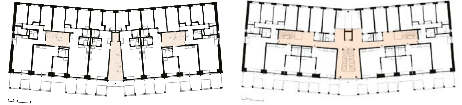
Plan du 1 er étage (g) L'ascenseur ne dessert que les appartements du milieu. L'accès aux autres appartements est possible par les passerelles. Au 3 e étage (d), la «rue intérieure» met en relation l'ascenseur et les cages d'escaliers situées à l'Est et à l'Ouest. DR