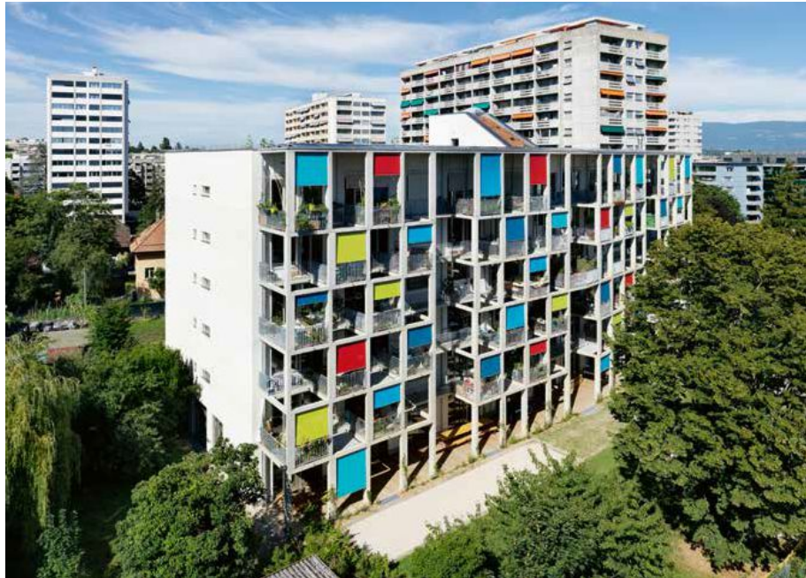
Les livings donnent sur le Sud. Les espaces laissés entre les balcons assurent un supplément de luminosité aux appartements.