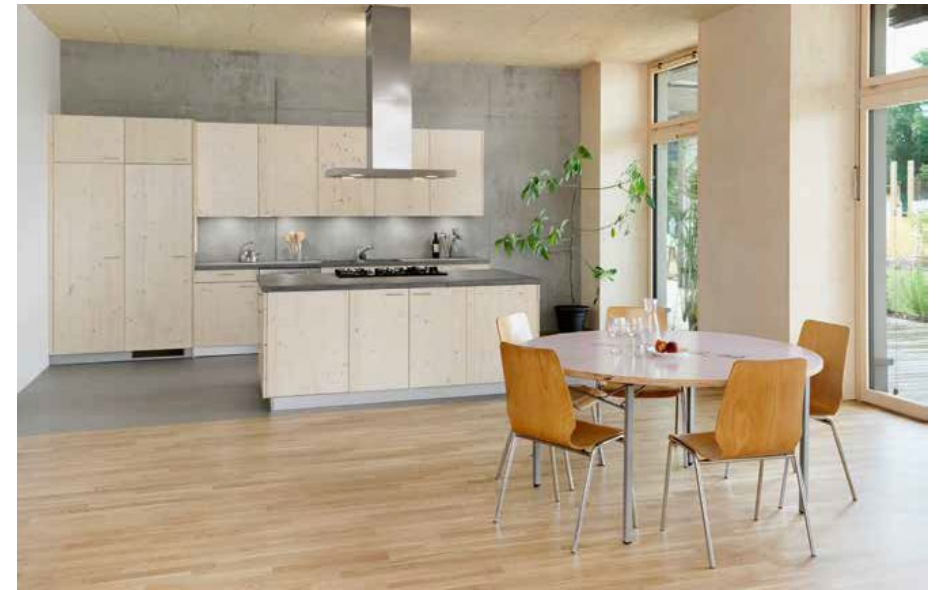
La grande salle commune.