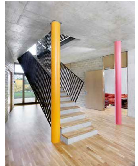
Le hall d'entrée et une petite salle commune.

Le paramètre économique est très présent. Par exemple, les coopérateurs ont opté pour un système d'auto-épuration de l'eau (lire ci-contre). Un promoteur de logements modéré classique ne se serait jamais lancé dans pareille aventure, ne serait-ce qu'en raison des centaines de milliers de francs à investir. Mais Equilibre et