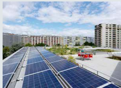
Les panneaux solaires se partagent l'espace du toit avec une terrasse et un potager communs.

Si tout le monde n'est pas devenu membre d'EnerKo, en revanche, par décision des conseils d'administration d'Equilibre et de Luciole, les habitants sont membres de la communauté d'auto-consommateurs. «Cette appartenance apparaît comme une annexe au bail. De facto, un habitant aurait pu refuser, mais le cas ne s'est pas présenté», poursuit le co-RMO. Au début de l'été, des négociations étaient encore en cours avec les SIG à propos du type de contrat les liant à la communauté d'autoconsommateur, qui souhaiteraient être contractuellement liées à un représentant de la communauté d'autoconsommation. L'installation, dont la conception et l'installation s'est élevée à quelque CHF 60000, a bénéficié d'une subvention fédérale de CHF 16390. Elle produit un kWh à 22 ct (hors TVA), soit l'équivalent du prix du kWh SIG Vitale bleu mais de qualité SIG Vitale soleil (100% solaire) à 34 ct (hors TVA). VB